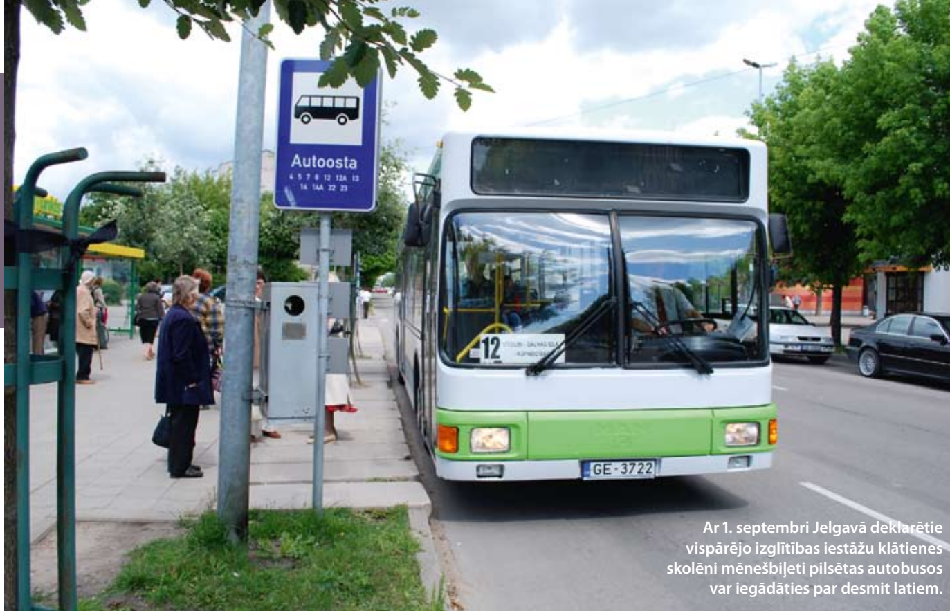
Ar 1. septembri Jelgavā deklarētie vispārējo izglītības iestāžu klātienē skolēni mēnešbiļeti pilsētas autobusus var iegādāties par desmit latiem.

Ozolnieku novadā beigusies cenu aptauja un tajā labākais izrādījies SIA Migar piedāvājums, kurā uzņēmums apņēmis jaunajā mācību gadā pārvadāt Ozolnieku novada skolēnus par 32 000 latu, neskaitot PVN, lai gan novada pašvaldība sākotnēji rēķinājusies ar 40 000 latu izdevumiem. Šis uzņēmums jau noslēdzis līgumus vēl ar vairākiem citiem Jelgavas novada pagastiem par skolēnu nogādāšanu mācību iestādēs.