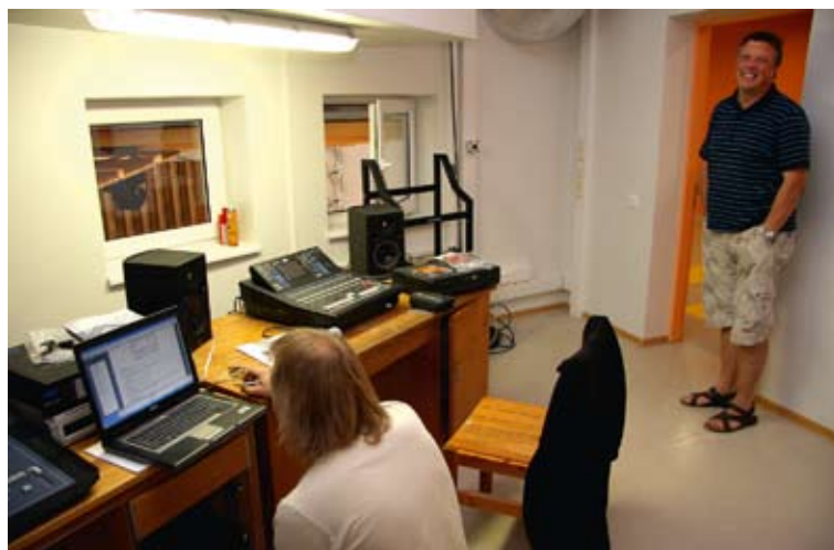
Jelgavas 4. vidusskola tikusi arī pie modernas aparātūras.

Atgādinām, ka skola tikusi pie jauna, 5713 kvadrātmetru plaša trīsstāvēga korpusa. Tajā atrodas aktu zāle, mācību telpas, bibliotēka ar lasītavu, kā arī konferenču telpa. Jaunais korpus ir savienots ar pārējo skolas ēku. Projekta ietvaros jau pērn oktobrī Jelgavas 4. vidusskolai tika pabeigta ēdnīcas izbūve, kas ļāva iepriekšējo ēdnīcas zāli rekonstruēt par nelielu sporta zāli mazāko klašu skolēniem. □