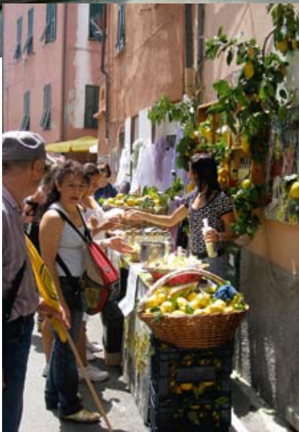
Ielu tirdziņš Monterosso ciematā.