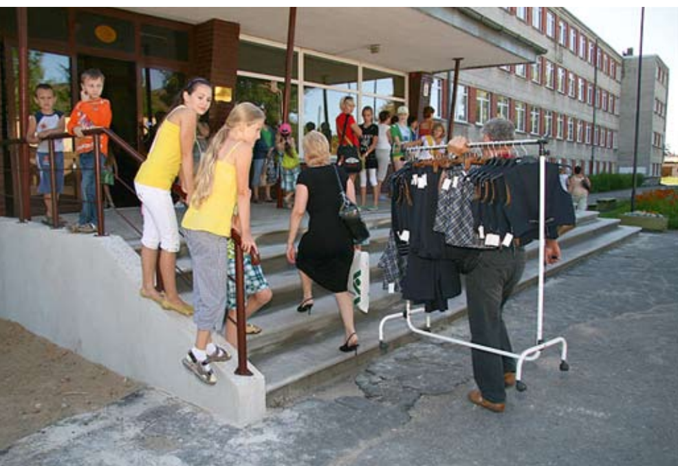
Vairākas Jelgavas skolas piekritušas izmēģināt skolas formas.