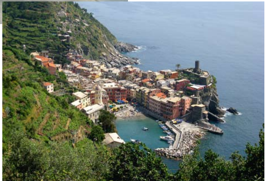
Skats uz Cinque Terre no kalnu takas, kur pēc tūristu paražas visi sastopoties draudzīgi sveicinājās.