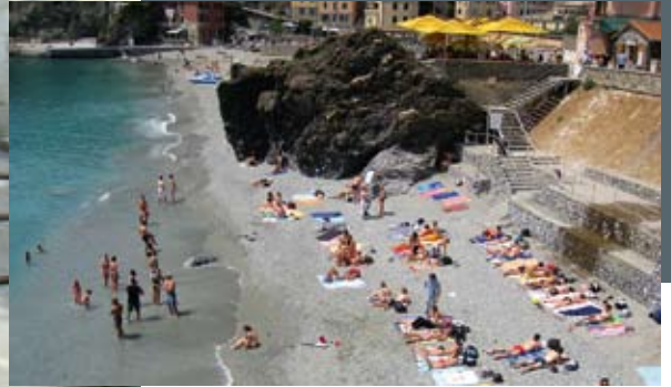
Lai gan bija karsts, Itālijas mazās, pelēkām smiltīm klātās pludmales latviešus peldēt nevilināja.