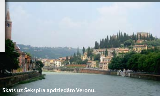
Skats uz Šekspīra apdziedāto Veronu.

Ceturtajā ceļojuma dienā atgriezāmies Milānā, kur ievērojām, ka cilvēki tur ģērbušies ļoti rūpīgi – karstā vasarā cilvēki staigā melnos uzvalkos, zeķubiksēs! Toties visiem – drēbes ar vārdu , kas itāļiem ir ļoti svarīgi. Milānā pavadījām divas jaukas dienas, taču noslēgumā piedzīvojām pamatīgu nelaimi – nokavējām lidmašīnu!