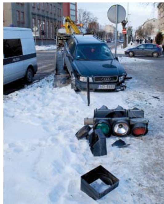
Pasta un Raiņa ielu krustojumā 19. janvārī pēc divu transportlīdzekļu sadursmes pārstāja darboties visi luksofori, turklāt negadījumā viens no tiem tika nogāzts.