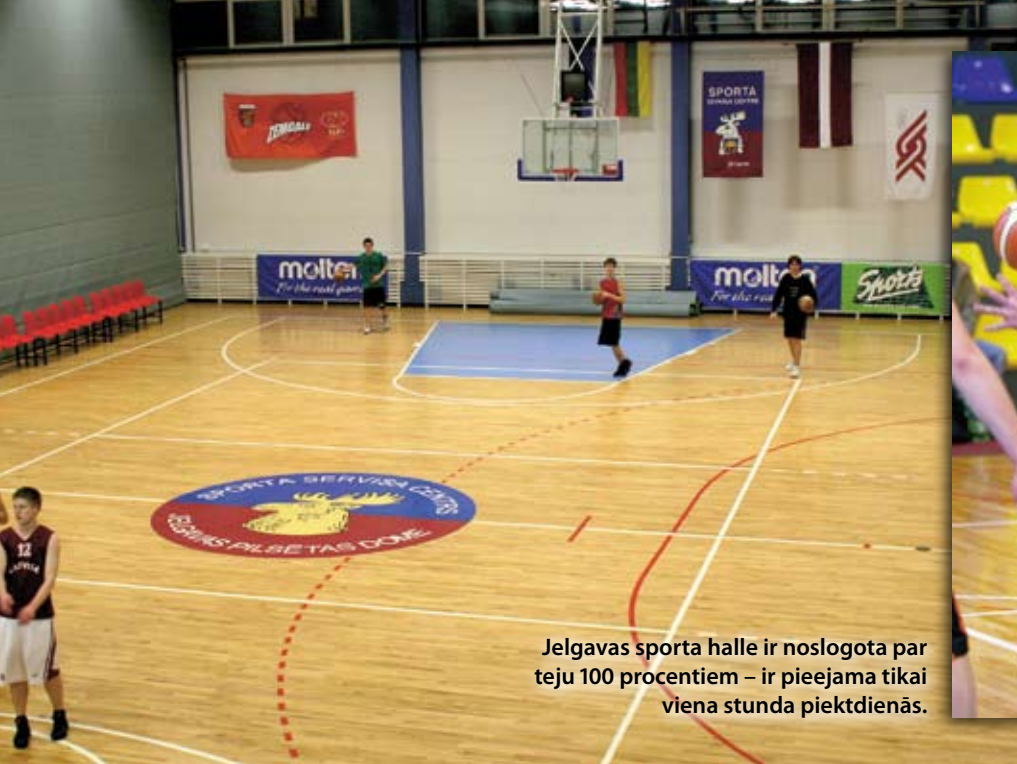
Jelgavas sporta halle ir noslogota par teju 100 procentiem – ir pieejama tikai viena stunda piektdienās.