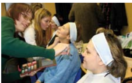
Jelgavas sieviešu invalīdu organizācija Zvaigzne viesojās vizāžistes, kas ar dekoratīvās kosmētikas palīdzību sievietes padarīja vēl skaistākas.