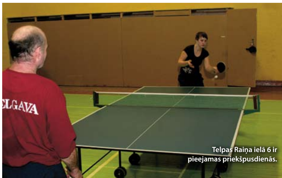
Telpas Raiņa ielā 6 ir pieejamas priekšpusdienās.