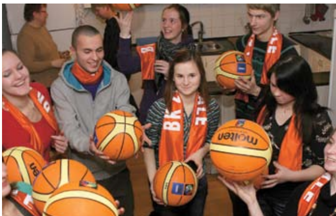
Swedbank Latvijas Jaunatnes basketbola līgas Talantu nedēļas akcijā Bumbas skolām Jelgavas basketbola kluba Zemgale sportisti dāvāja 100 basketbola bumbas Jelgavas SOS jauniešu mājai.