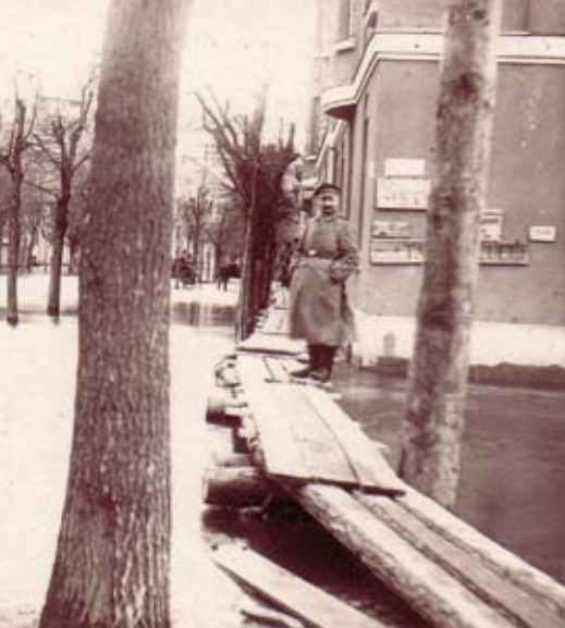
Tagadējās Akadēmijas ielas un Vaļņu ielas stūris. Laipa ved stacijas virzienā no nama Vaļņu ielā, kur Pirmā pasaules kara laikā atradās virsnieku viesnīca. Attēls tiražēts skatu kartēs Pirmā pasaules kara laikā.