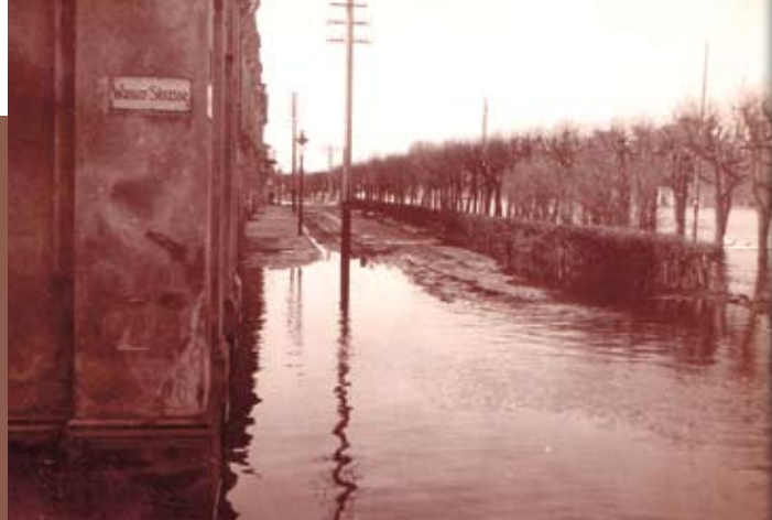
Tagadējās Ūdens ielas un Čakstes bulvāra stūris pie Driksas 1917. gadā.