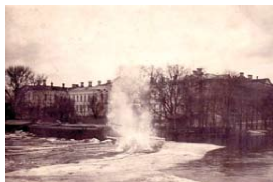
Ledus iešana Lielupē pie Jelgavas pils. Fotogrāfija veikta no vācu uzbūvētā Lielupes koka tilta 1917. gadā. Vācu zaldāti spridzināja ledu gan Lielupē, gan Driksā.

visam dienas bija skaistas un siltas. Spīdēja saule un spoguļojās palu ūdeņos. Bet applūdis toreiz bija arī viss Cukura ielas rajons,» kundze atceras.