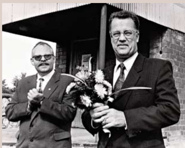
Vēsturnieks Andris Tomašūns ar Valsts prezidentu Gunti Ulmani Spīdolas ģimnāzijā 1993. gada 1. septembrī.