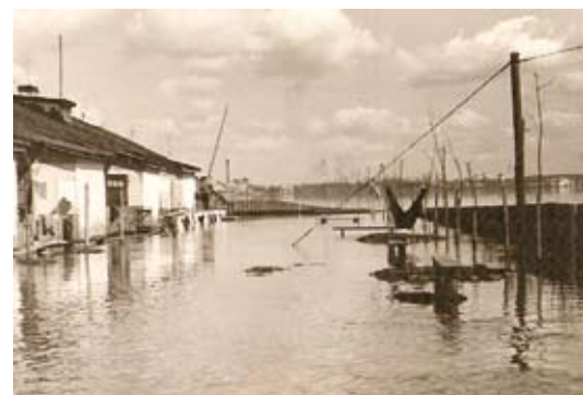
Skats uz no krastiem izgājušo Lielupi Bauskas ielā 1958. gada 20. aprīlī.