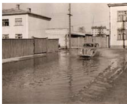
1958. gada aprīlī ūdens nopietni applūdināja 2. vidusskolas pagrabus. Fotogrāfijā redzams tagadējās Mātera ielas un Ūdensvada ielas krustojums.