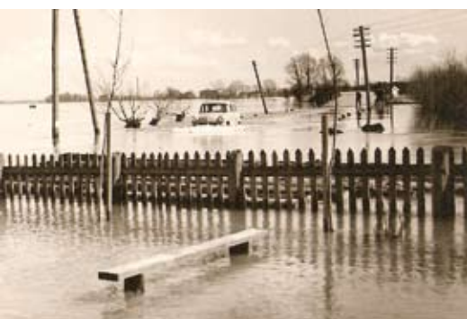
1958. gada aprīlī plūdi skāra daudzas Jelgavas zemākās vietas. Bauskas iela un no krastiem izgājusi Platone un Lielupe. Platones tilts ūdenī.