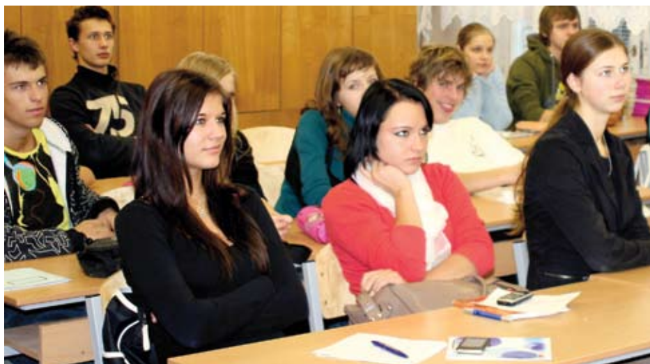
Jelgavas skolēnu rezultāti centralizētajos eksāmenos latviešu valodā, angļu valodā, krievu valodā, matemātikā, vēsturē un fizikā šajā gadā ir labāki nekā vidēji valstī.

Ilgākā laika periodā labi sasniegumi Jelgavas 1.ģimnāzijas absolventiem ir vācu, krievu, latviešu valodas un fizikas CE, Jelgavas Valsts ģimnāzijas absolventiem – latviešu, angļu un krievu valodas, matemātikas, ķīmijas un vēstures CE, Jelgavas 4.vidusskolas absolventiem – vācu, latviešu valodas un vēstures CE, Jelgavas Spīdolas ģimnāzijas absolventiem – latviešu, angļu, vācu, krievu valodas un vēstures CE, Jelgavas 5.vidusskolas absolventiem – fizikas, valsts valodas un matemātikas, bet Jelgavas 6.vidusskolas absolventiem – valsts valodas un matemātikas eksāmenos. □