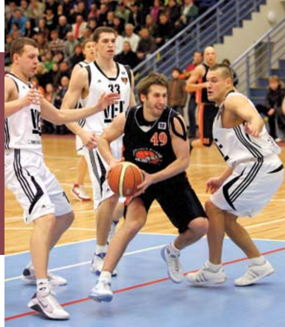
Basketbola kluba Zemgale darbībai piešķirti 30 tūkstoši latu un vēl apmēram 10 tūkstoši telpu nodrošināšanai treniņiem un spēlēm.