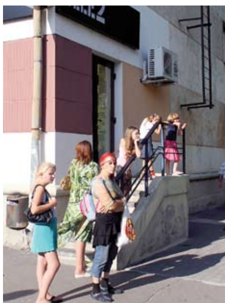
Augusta sākumā pirmklasnieku vecāki dežūrēja pie Tele2 klientu apkalpošanas centriem, lai bez maksas varētu saņemt mobilo telefonu.