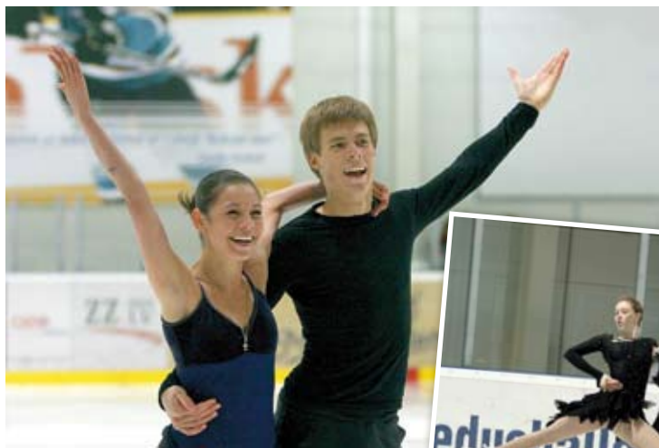
Jūlijā Ozo ledus hallē treniņnometni aizvadīja Krievijas daiļslidošanas zvaigznes.