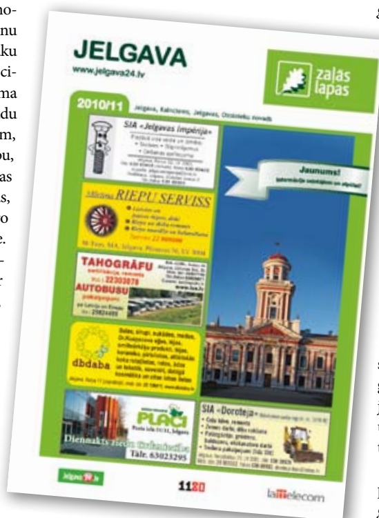
Klajā nācis uzziņu katalogs Zaļās Lapas Jelgava 2010/11 .

Pirmās grāmatas bija melnbaltas un ne viņiem šķita pārredzamas un parocīgas. Taču laika gaitā tās ievērojami mainījušās satura, formas un informācijas ziņā. Ar katru gadu grāmatas piedāvājums kļūst arvien profesionālāks un pilnīgāks. □