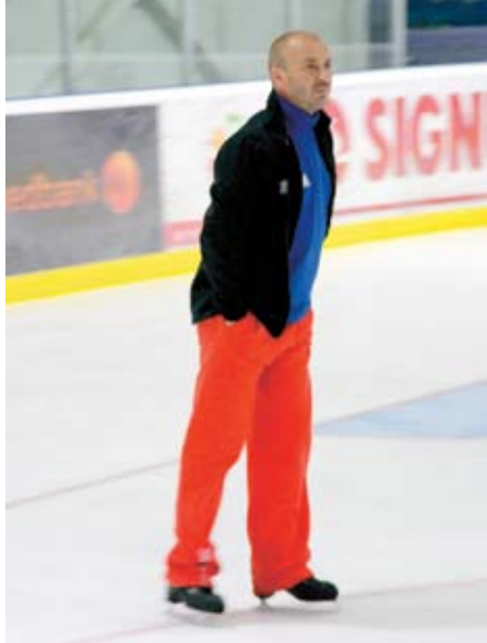
Jūlija vidū Ozo ledus hallē viesojās divu olimpisko spēļu bronzas medaļu laureāts, pasaules un Eiropas čempions un citiem tituliem bagātais un šī sporta veida aprindās plaši pazīstamais Aleksandrs Žuļins no Krievijas, kas pašlaik trenē jaunās zvaigznes.