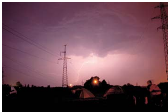
Zibens negaisa laikā 8. augusta naktī pie Lielupes.

Jūlijā un arī augusta sākumā Jelgavā vairākkārt plosījās negaiss ar stiprām lietusgāzēm un brāzmainu vēju. Pēc tā daudzviet pilsētā ielas bija zem ūdens.