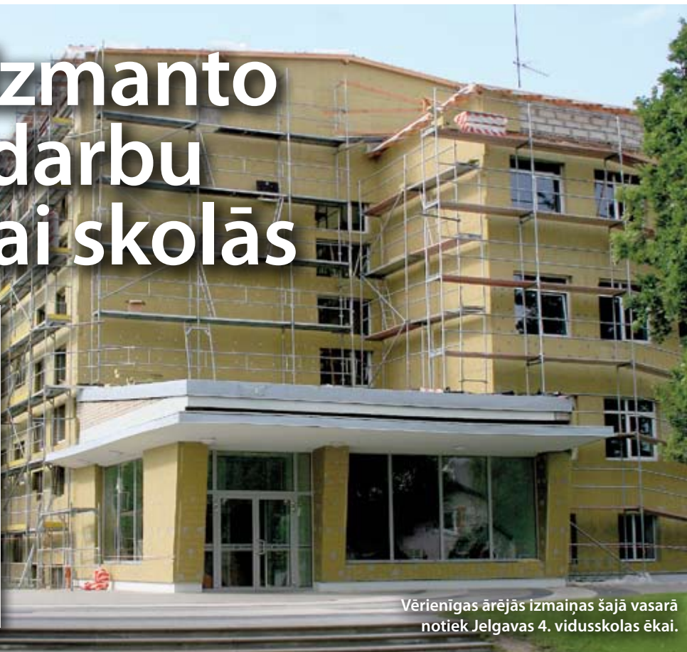
Vērienīgas ārējās izmaiņas šajā vasarā notiek Jelgavas 4. vidusskolas ēkai.

Izmantojot laiku, kad skolēniem un daļai pirmsskolas izglītības iestāžu audzēkņu ir brīvlaiks, vairākos Jelgavas bērnudārzos un skolās vasarā notiek energoefektivitātes paaugstināšanas, infrastruktūras uzlabošanas pasākumi un dažādi citi remontdarbi.