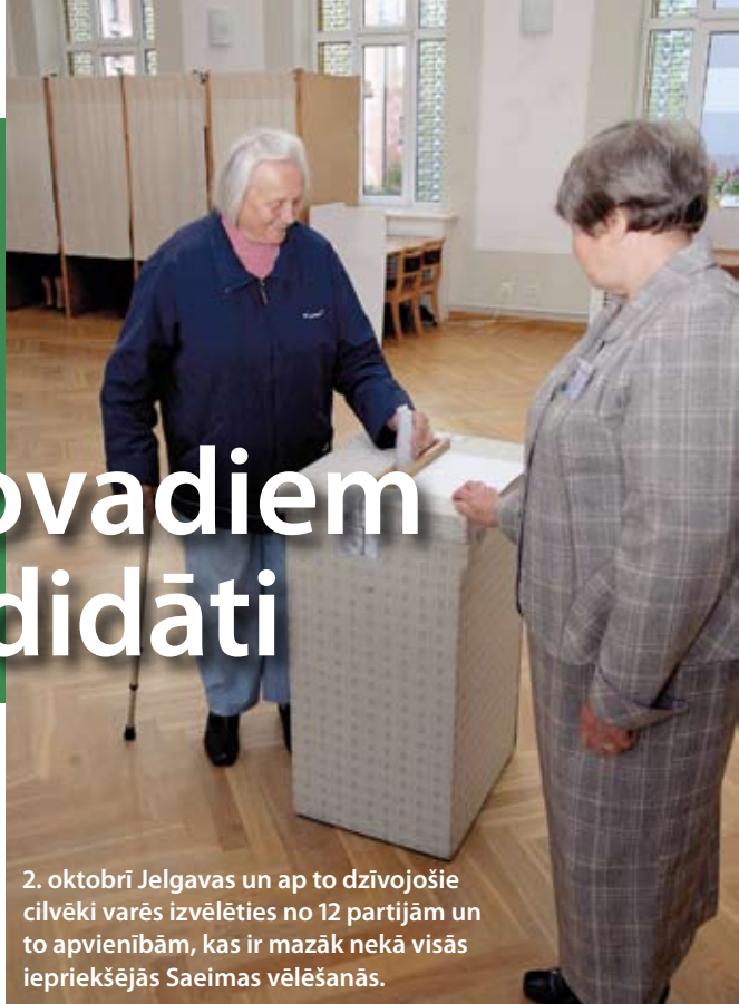
2. oktobrī Jelgavas un ap to dzīvojošie cilvēki varēs izvēlēties no 12 partijām un to apvienībām, kas ir mazāk nekā visās iepriekšējās Saeimas vēlēšanās.