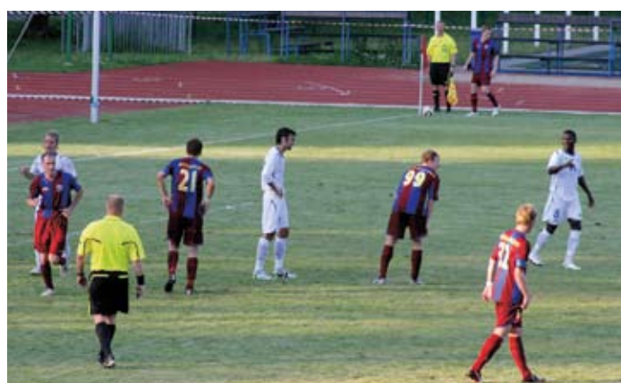
Futbola klubs Jelgava UEFA Eiropas kvalifikācijas 2. kārtas atbildes spēlē ar 2:1 pieveica Norvēģijas klubu Molde. Taču divu maču summā cīnoties neizšķirti 2:2 tālāk tika Molde, pateicoties viesos gūtajiem vārtiem.

Ap 30 dažāda vecuma cilvēku 13. augustā izmēģināja savus spēkus adaptētajā triatlonā. Tajā viņiem bija jāpeld, jāskrien, kā arī jābrauc ar velosipēdu.