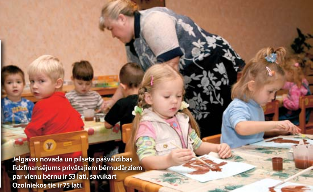
Jelgavas novadā un pilsētā pašvaldības līdzfinansējums privātajiem bērnudārziem par vienu bērnu ir 53 lati, savukārt Ozolniekos tie ir 75 lati.

Jūlija beigās rindā uz pašvaldības pirmsskolas izglītības iestādī bija 2028 bērni. Par šo jomu atbildīgā speciāliste skaidro, ka tiekot darīt viss, lai rindu mazinātu. Tāpat pašvaldība turpina piešķirt dotācijas privātajiem bērnudārziem, tiesa gan šī summa ir daudz mazāka nekā, piemēram, blakus esošajā Ozolnieku novadā.