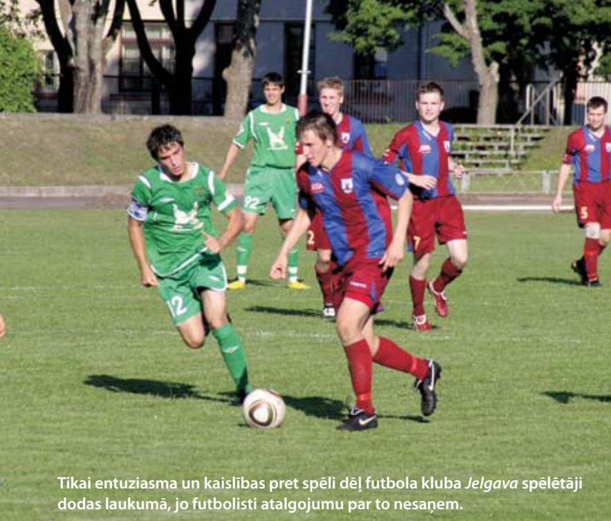
Tikai entuziasma un kaislības pret spēli dēļ futbola kluba Jelgava spēlētāji dodas laukumā, jo futbolisti atalgojumu par to nesaņem.