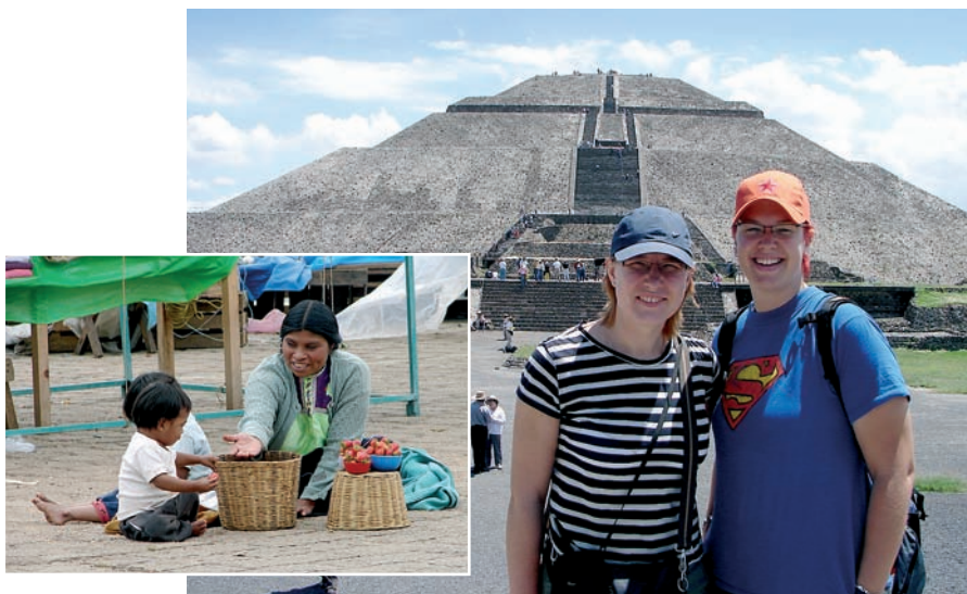
Īpaši mīļa fotogrāfija, jo par spīti valdošajai nabadzībai, iedzīvotāji ir mūždien smaidīgi un atsaucīgi