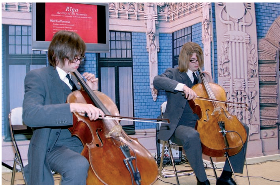
"... un spēlē", Latvijas logo "Zeme, kas dzied" starptautiskajā tūrisma izstādē Londonā veiksmīgi papildināja "Melo-M" čellisti

Es uzskatu, ka viedoklis par Latvijas unikālo arhitektūru kā vienu no