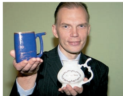
Minerālūdens nav jādzer no pudeles, bet jāsūc caur osiņu no īpašas formas krūzītes