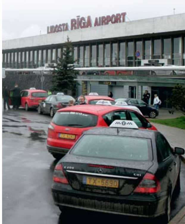
Šobrīd situāciju saspīlē arī “airBaltic”, aicinot savus pasažierus izmantot “Airport Express” mikroautobusus, nevis taksometrus