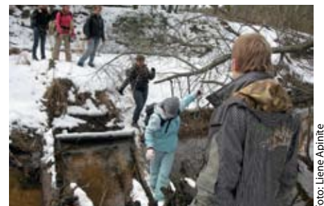
Pārgājiena laikā ūdens šķēršļi kļuva par ierastu lietu, kaut dažam nācās pat mainīt samirkušās drēbes