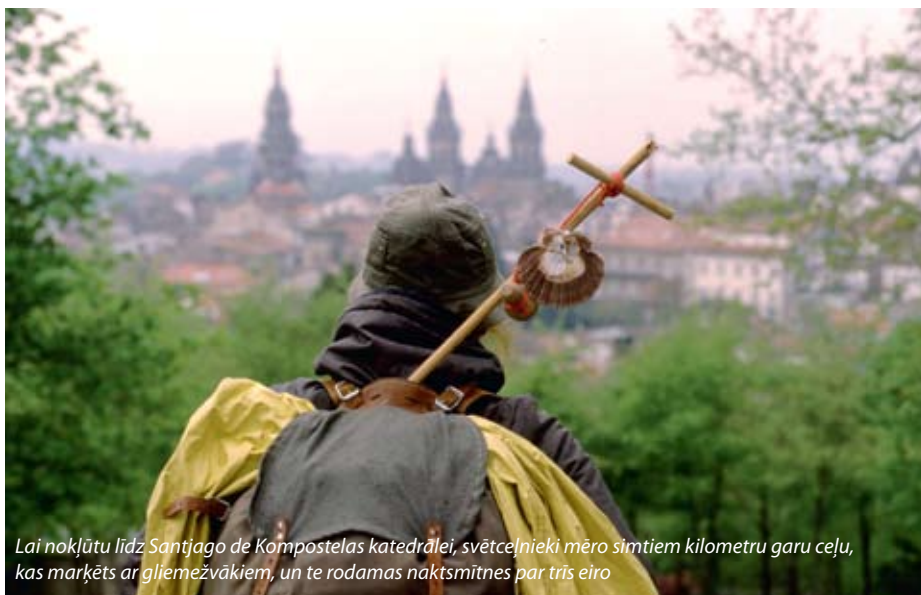
Lai nokļūtu līdz Santjago de Kompostelas katedrālei, svētcēlnieki mēro simtiem kilometru garu ceļu, kas marķēts ar gliemežvākiem, un te rodamas naktsmītnes par trīs eiro

tā un apkārtējā reģionā. Gan gastronomijas programmas, gan dažādi tematiskie maršruti, galvenokārt ar vēstures, kultūras un reliģijas ievirzi. Senās universitātes apmeklēšana, lauku tūrisma piedāvājumi, bet galvenais – viss apvīts ar stāstiem un leģendām. Piemēram, pavisam vienkāršs krodziņš, pateicoties tā leģendai, vakaros ir pārpildīts. Turklāt klāt pievienots arī spēles elements – zīmodziņu krāšana.