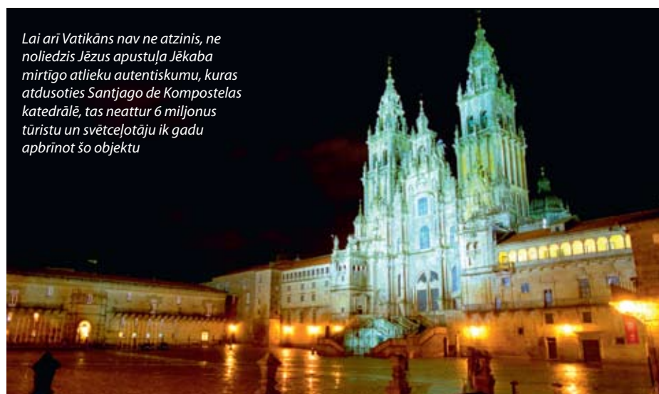
Lai arī Vatikāns nav ne atzinis, ne noliedzis Jēzus apustuļa Jēkaba mirtīgo atlieku autentiskumu, kuras atdusoties Santjago de Kompostelas katedrālē, tas neattur 6 miljonus tūristu un svētcēļotāju ik gadu apbrīnot šo objektu

Ceļojumus uz Portugāli un Spāniju, kuros iekļauta arī Santjago de Kompostelas apmeklēšana vienas vai pusotras dienas garumā, piedāvā arī Latvijas tūrisma aģentūras, piemēram, “Impro”, “Travellatvia”, “Ap Sauli”. Attīstīt šo virzienu tūrisma firmām un individuālajiem ceļotājiem ļauj arī esošie avioreisi uz lielākajām Spānijas un Portugāles pilsētām. No tām savukārt ar zemo cenu aviokompānijām vai vilcieniem var nokļūt līdz Santjago de Kompostelai. □