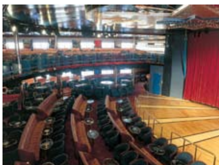
M/S "Romantika" ir viens no lielākajiem "Tallink" prāmjiem, kas kursē Baltijas jūrā. Tas ir plašs izklaides centrs, kas piedāvā iepirkšanās iespējas, atpūtu kādā no diskotēkām vai restorāniem

Prāmis M/S "Romantika" ļaus nodrošināt pasažieriem lielākas ērtības un aicināt uz klāja vairāk braucēju. "Tallink" prognozē, ka līdz ar "Romantikas" ienākšanu Rīgas pasažieru ostā, interesentu skaits pieaugs gan Latvijas, gan arī Zviedrijas iedzīvotāju vidū. Un būtiski ir arī tas, ka modernāks prāmis nenozīmē, ka tiks "modernizētas", proti, paaugstinātas arī cenas.