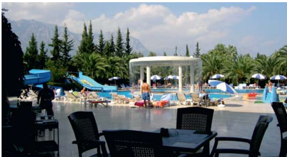
Turcijas ienākošā tūrisma pārstāvji šogad prognozē nevis tūristu skaita samazināšanos, bet gan tā pieaugumu. Viņi pamatojas uz to, ka cilvēki neatteiksies no ceļošanas, bet izvēlēsies lētākus variantus, kas neapšaubāmi dod priekšrocības tieši šai valstij, it sevišķi, ja salīdzina izmaksas un apkalpošā tūrisma kvalitāti