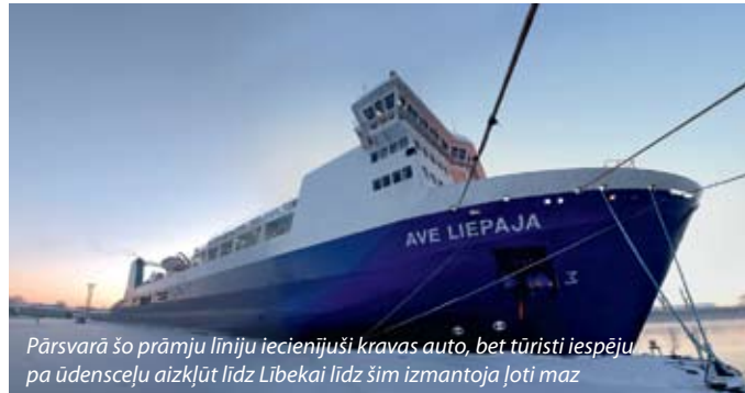
Pārsvārā šo prāmju līniju iecienījuši kravas auto, bet tūristi iespēju pa ūdensceļu aizkļūt līdz Lībekai līdz šim izmantoja ļoti maz