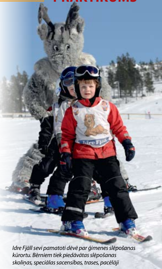
Idre Fjäll sevi pamatoti dēvē par ģimenes slēpošanas kūrortu. Bērniem tiek piedāvātas slēpošanas skoliņas, speciālas sacensības, trases, pacēlāji

Idre Fjäll stāvākajā trasē "Chocken" notiek arī Pasaules kausa izcīņa ātruma nobraucienā. Tad sacikstes tiek organizētas tā, lai netraucētu regulārajiem klientiem